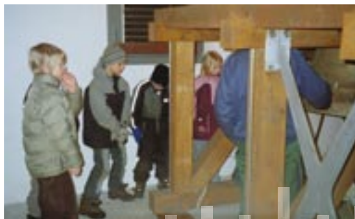
Minikonfirmander besøger Grene kirkes tårn

Vi kommer omkring nogle af livets store spørgsmål såsom livets begyndelse og slutning. Vi snakker om, hvorfor vi fejrer jul, påske og pinse.